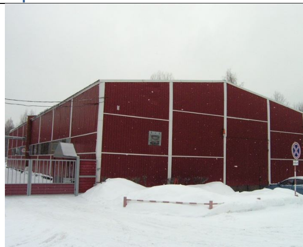
Газопровод к котельной