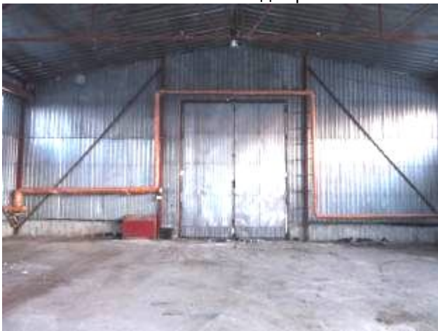
Фото 4. Внутренний вид строения