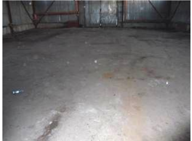
Фото 9. Внутренний вид строения