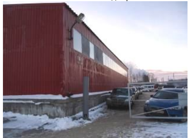
Фото 3. Внешний вид строения