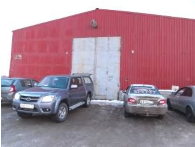
Фото 1. Внешний вид строения