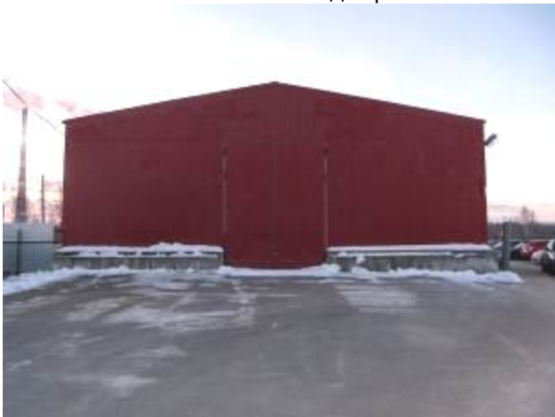
Фото 2. Внешний вид строения