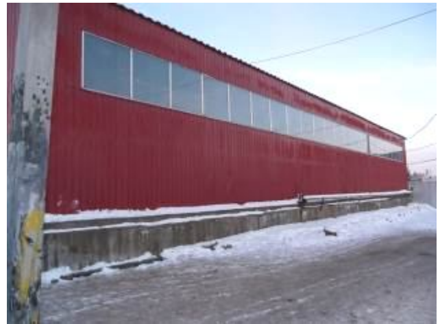
Фото 2. Внешний вид строения