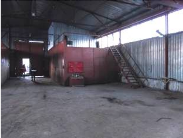
Фото 8. Внутренний вид строения