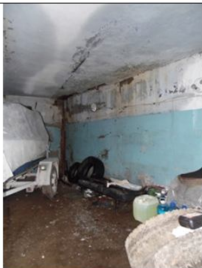
Состояние гаража 29,1 кв.м.