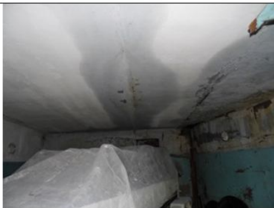
Состояние гаража 29,1 кв.м.